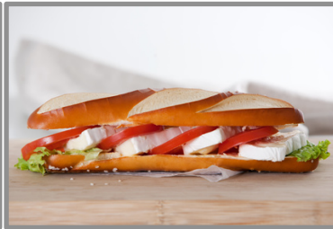
Laugenstangerl mit Käse